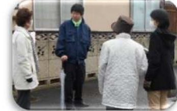
『声をかけてみます』