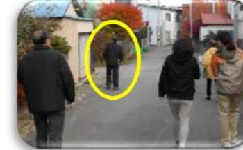
『不明高齢者らしき人を発見』