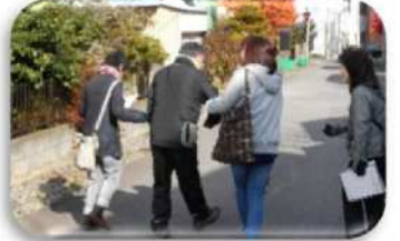
『一緒に家に帰る同意を得て終了』