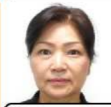
蔦屋 ケアマネジャー